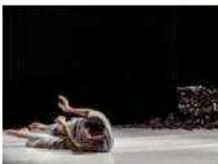
Daniel Abad, Premio Nacional de Danza, en una de las sesiones de talleres.

El programa de talleres de danza en Tenerife, así como el programa de festivales de danza de este fin de semana, forman parte de la gran iniciativa Dance-Inter-Faces. El programa de talleres de danza se celebrará el fin de semana del 20 al 22 de febrero en el teatro de la ciudad de Santa Cruz de Tenerife, con el objetivo de que los artistas canarios conozcan a los programadores internacionales que asistirán a la muestra de danza canaria que se celebrará el fin de semana del 20 al 22 de febrero en el teatro de la ciudad de Santa Cruz de Tenerife.