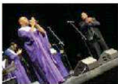
El conjunto Cospel Black Heritage da la nota...

LAGUÍA EN BREVE 100 años de historia del teatro Local